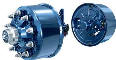
Axeltappar för dubbeldäckare och transporter av skivmaterial