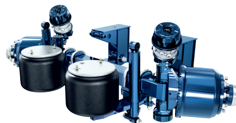
Styrbara axlar för specialfordon med särskilda mått och/eller multiaxlar