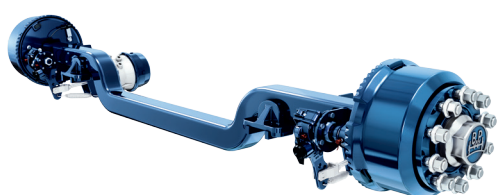
Krökta axlar för bil- och båttransporter

Oavsett om ni behöver transportera bilar, vindkraftverk eller hela borrhplattformar: Tillsammans med er utvecklar BPW skräddarsydda lösningar optimalt anpassade efter era behov.