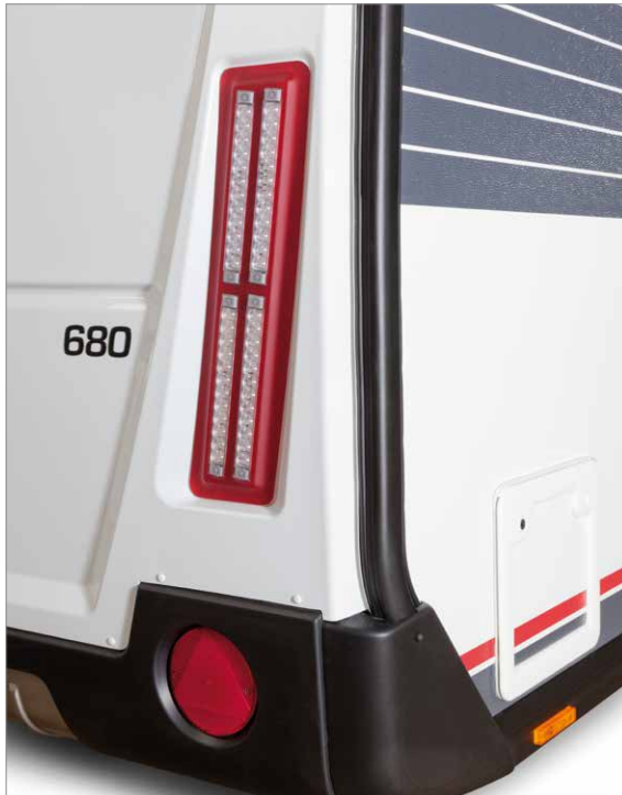
– Bakgaveln på nya Solifer Zenit 680

Det finns olika kit med artikelnummer för våra mest förekommande påskjutsbromsar.