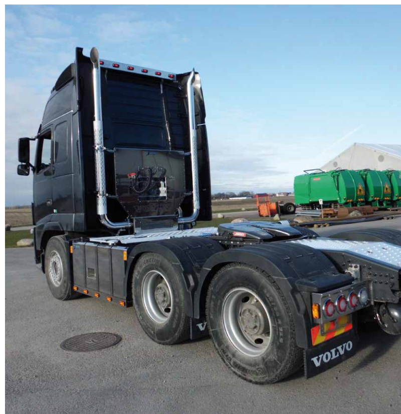
– Dragbil med Jost JSK 37 vändskiva och Jokon LED-lampor från FOMA

Vill du veta mer om FJ Lastvagnar, besök www.fjlastvagnar.se