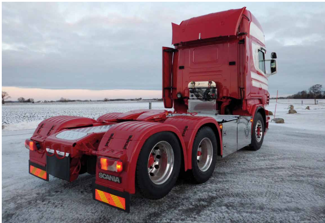
– Scania dragbil med Jost JSK37 20 ton med 660 mm flyttbarhet

FJ Lastvagnar arbetar i dag mycket med att bygga om mer specialiserade fordon. I utbudet finns allt från enklare dragbilar, lastväxlare och dumperbilar till de mäktigaste tungdragare på 200 ton. De levererar dessutom detaljer direkt till lastbilstillverkarna, då det som tidigare var extrautrustning börjat bli en del av standardsortimentet.