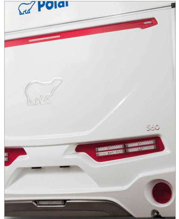
– Bakgaveln på nya Polar 560