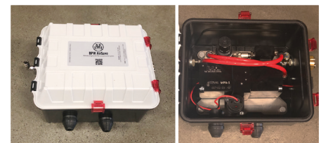
Elektronisk kontrollenhet och tryckstegrare

BPW AirSave garanterar 100 % kontroll av däckstrycket, 100 % säkerhet och 100 % självstyrande system.